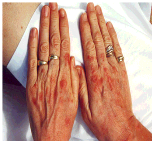
Typisches Erscheinungsbild.