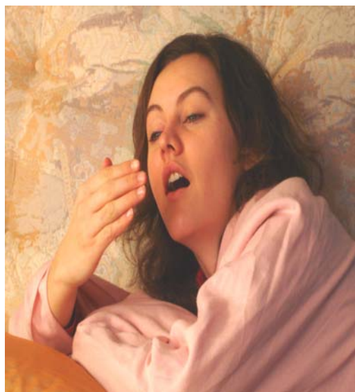
Alle Jahre wieder: Monatelanges Unwohlsein.